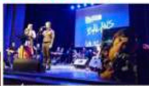
Balans, mühendislerden tam net aldı