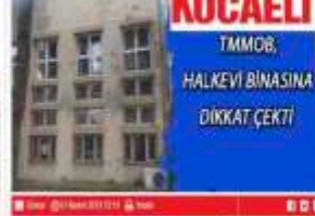
Kocaeli Halkevi statüsü kaldırılmalı ve işlevsizleştirilmelidir