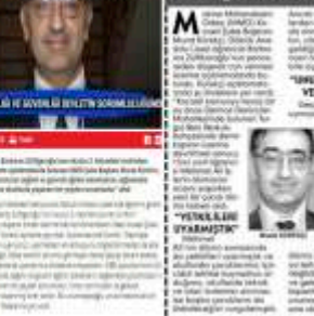
Çocuklarımız okullarında ölmeye devam ediyor