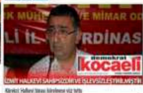
İzmit Halkevi statüsü kaldırılmalı ve işlevsizleştirilmelidir