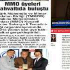
MMO üyeleri kahvaltıda buluştu