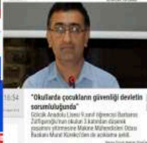
Okullarda çocukların güvenliği devletin sorumluluğunda