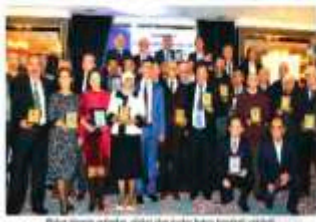
Yüksek Mühendisler Odası (YMM) Kocaeli Şubesi üyeleri, geçtiğimiz hafta düzenlenen 'Vefa Gecesi' etkinliğinde bir araya gelmişlerdir.