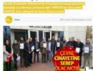
Çevre Cinayetine Sebep Olacaktır