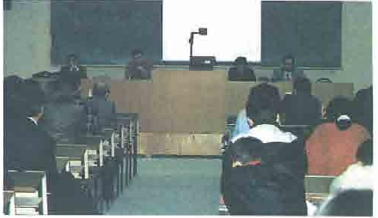
Öğrenci Kulüplerinin Bursa Çevre Paneli