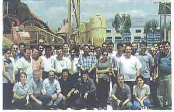
Baca Gazı Teknik Görevli Eğitimi -İzmir