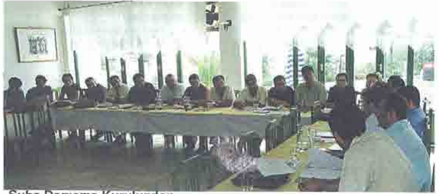
Şube Danışma Kurulundan