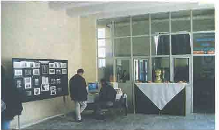
Öğrenci Kulüp Mekanı