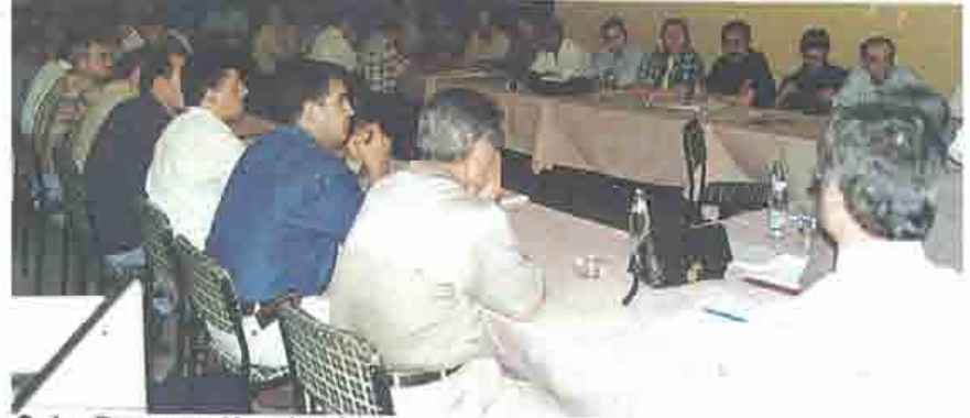
Şube Danışma Kurulundan