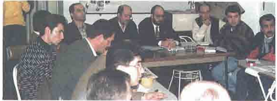
Şube Danışma Kurulu -Balıkesir