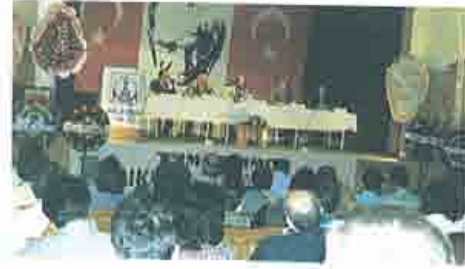
Balıkesir Çevre-98 Paneli