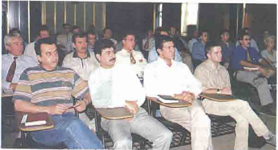
Kaldırma Makinalarında İş Güvenliği Semineri

*"Kaldırma Makinalarında İş Güvenliği Semineri" gerçekleştirildi. (11 Eylül 1998)