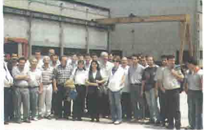
Teknik Görevli Eğitimi -Bursa