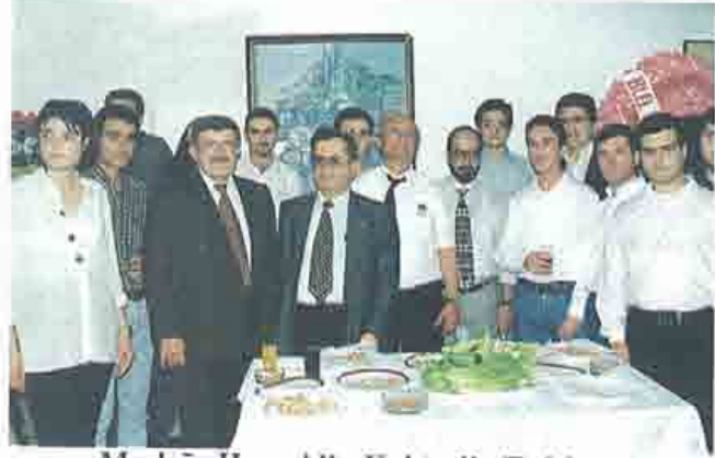
Mesleğe Hoşgeldin Kokteyli (Balıkesir)

*16.12.1998 tarihinde Mühendislik Mimarlık Fakültesi Makina ve Endüstri Mühendisliği Bölümü öğrencilerine odamızı tanıttığı bir toplantı düzenlenmiştir.