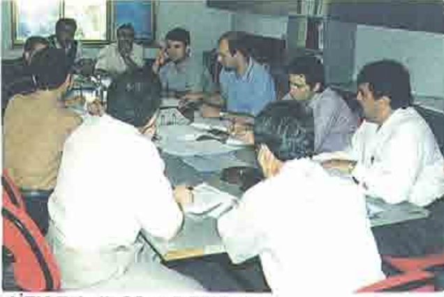
AİTM Teknik Görevli Eğitimi

*TMMOB MMO Teknik Görevlileri Baca Gazı Emisyon Ölçümü Eğitimi-İZMİR-21-22 Haziran 1999