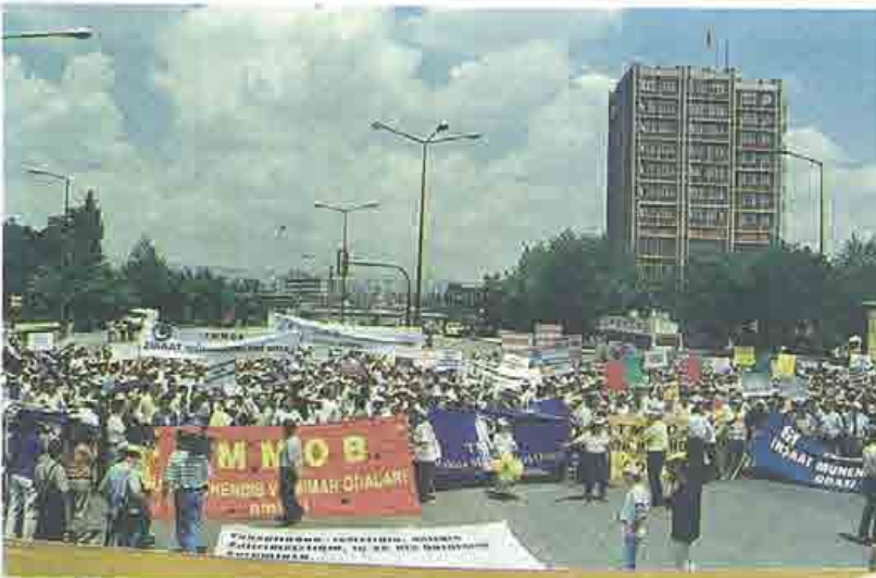
Ankara Tandoğanda yapılan mitinge katıldı.

*TMMOB ile Fan Kulüp işbirliğiyle depremzedelere 100 çadır gönderildi. 30 Ağustos 1999