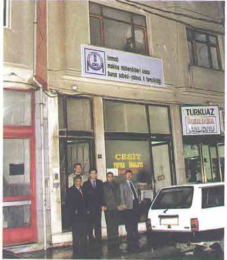
Yalova İl Temsilcilikine Yer Alındı