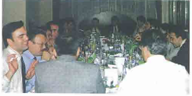
Uluda Üniversitesi Öğrencileri ile ilgili yemek düzenlendi