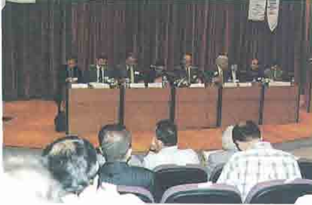
Asansörlerle Teknik Görevli Eğitimi