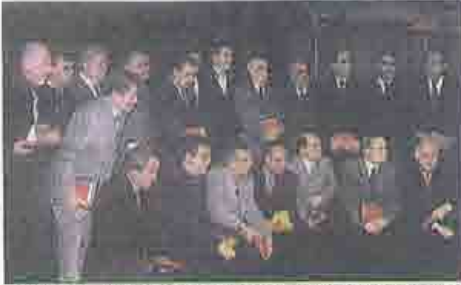
Meslekte 50., 40. ve 25. yılını dolduran 26 makina mühendisine onur belgeleri ile plakalarının da verildiği Makina Mühendisleri Odası Bursa Şubesi'nin Almira Otel'deki gecesi anısına imza attı.

Makina Mühendisleri Odası (TMMOB) Bursa Şubesi ile Gemlik Belediyesi arasında kaçak yapılaşmanın önlenmesi amacıyla yapılan protokolde, tüm binaların denetlenmesi kararı alındı