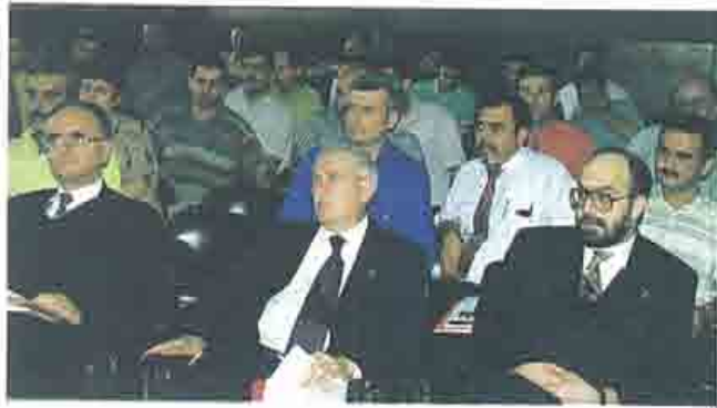
Üniversal A.Ş. ile Ortak Seminer düzenlendi