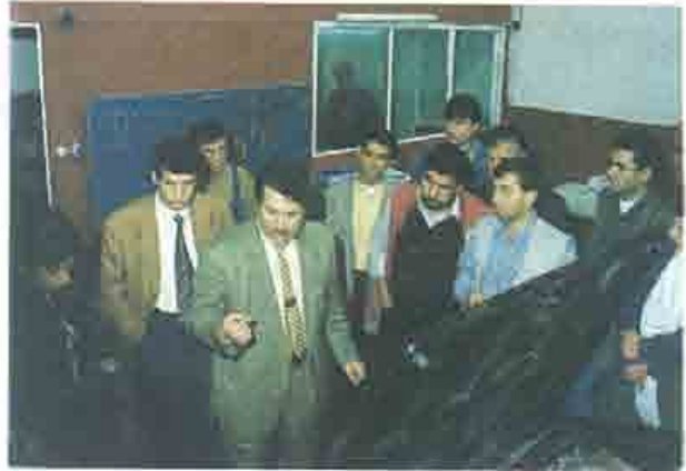
LPG Teknik Görevli Eğitimi

*AİTM Yönetmeliği kapsamındaki münferit tadilat proje onayları ile ilgili, Bursa Şube Teknik Görevlileri eğitimden geçirildi. 10 Nisan 1999 -BURSA