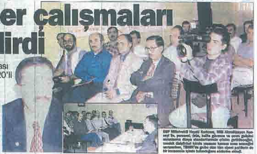
ÜST Milletvekili Hayati Korkmaz, Millî Akreditasyon Konseyi ile, personel, ürün, kalite güven ve çevre güvenli sorunlarını dünya standartlarında çözüme getireceğini, mevcut dışađışta içinde yaşanan krizden kurtulma sürecinde, TMMOB'de grubu olan tüm üyeleri partilerin de bir kongresinde buluşacağını söylemişti.