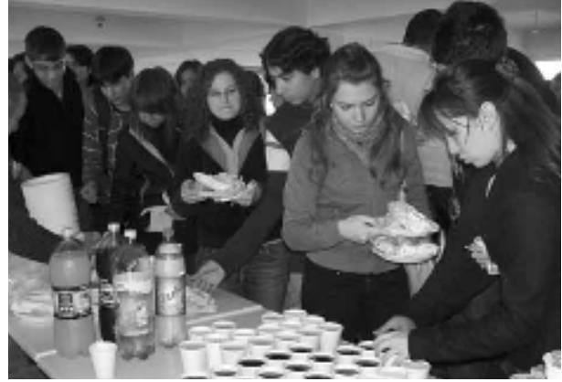
Endüstri Mühendisliği Bölümü'ndeki ikram.