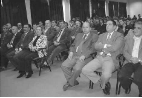
Makina Mühendisliği Bölümü'nde buluşma.

Osmangazi Üniversitesi Mühendislik ve Mimarlık Fakültesi, Makina ve Endüstri Mühendisliği Bölümlerine yeni başlayan 1.sınıf öğrencilerine Odamızı ve etkinliklerimizi tanıtmak, öğrenci üyelik hakkında bilgi vermek amacıyla 22 Ekim 2007 tarihinde Makina Mühendisliği Bölümünde, 2 Kasım 2007 tarihinde Endüstri Mühendisliği Bölümünde "Bölüme Hoşgeldin Buluşmaları" düzenlendi.