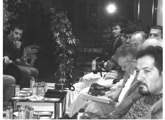
“Afyonkarahisar İl Temsilciliği LPG ve CNG Uygulamalarında Kontrol Kriterleri”

Kütahya'da 14:00-16:00 saatleri arasında verdiği