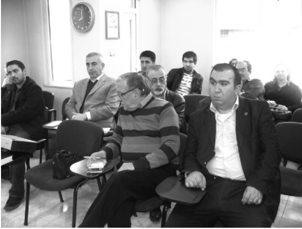
“Kütahya İl Temsilciliği LPG ve CNG Uygulamalarında Kontrol Kriterleri”

Afyonkarahisar ve Kütahya İl Temsilciliklerimizde 22 Ekim 2010 tarihinde LPG ve CNG Uygulamalarında Araç İmal Tadil Montaj Konularında Serbest Müşavirlik Mühendislik hizmetleri veren üyelerimize yönelik “LPG ve CNG Uygulamalarında Kontrol Kriterleri” seminerleri düzenlendi.