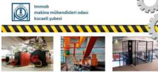
PERİYODİK KONTROL MUAYENE PERSONELİ TEMEL EĞİTİMİ

07-08 Nisan 2021 tarihlerinde Periyodik Kontrol Muayene Personeli Eğitimi (Çevrimiçi) 23 kişinin katılımıyla gerçekleştirildi.