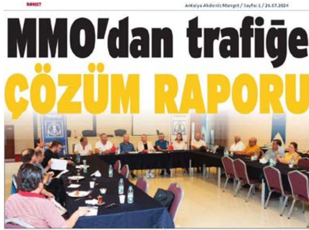
Makina Mühendisler Odası (MMO) Antalya Şubesi tarafından hazırlanan Antalya'nın kent içi ulaşım sorunlarına yönelik çözüm önerilerini içeren rapor kamuoyu ile paylaşıldı. Atmaca, sorunun siyaset üstü ele alınması gerektiğini belirterek, "Antalya'nın sabrı kalmadı" dedi

Antalya kent içi ulaşım sorunlarını ve çözüm önerilerini dile getirdiğimiz açıklamalar, gazetelerde geniş yer buldu.