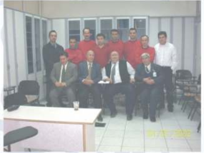
30 Mart 2004, Super Film A.Ş.