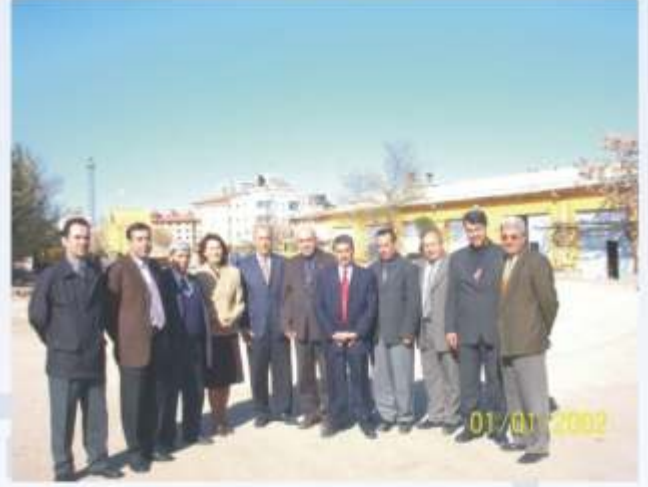
30 Mart 2004 , Köy Hizmetleri İl Müdürlüğü

İş yerlerindeki toplantılarda genelde Oda faaliyetleri ve üyelerin sorunları üzerinde tartışıldı. İş yerlerinin zaman açısından uygunluğuna göre, iş yeri ziyaretleri ve temsilcilik atama çalışmaları önümüzdeki günlerde de devam edecektir.