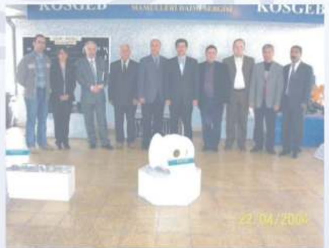
22 Nisan 2004 , KOSGEB