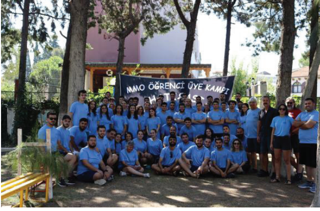
10. Oda Öğrenci Üye Kampı Gerçekleştirildi