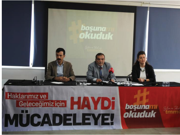
Cumhuriyetin 100. Yılında Haklarımız ve Geleceğimiz İçin Mücadeleyi Büyütüyoruz!